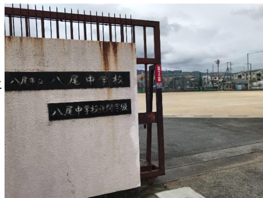
【写真】八尾市立八尾中学校 正門

その後、八尾競馬場は軍馬用鍛錬場としてしばらく使用されていましたが、昭和15年(1940年)、競馬場の敷地は近畿日本鉄道に買収され、住宅開発が始まります。翌年の昭和16年(1941年)には競馬場跡地に私立双葉高等女学校が新設され、昭和22年(1947年)には現在の八尾中学校が発足します。たった10年弱という短い歴史と土地開発による景観の変化で、現在の八尾の町に競馬場があった痕跡はなく、資料もほとんど残っていません。